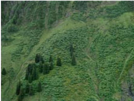
Christoph Engel Cuvretg 1 (Puzzatsch), 2005

Für mich ist die Fotografie ein Akt des Beobachtens. Es ist mehr eine Reaktion – im Gegensatz zur Malerei, die für mich einen aktiveren Charakter hat. Fotografie bildet zwar nicht die Realität ab, hat aber doch trotz oder auch wegen aller technischen Möglichkeiten eine starke Realitätsbindung. Es geht für mich darum, von der Welt um mich herum