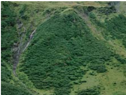
Christoph Engel Cuvretg 4 (Ramosa), 2005