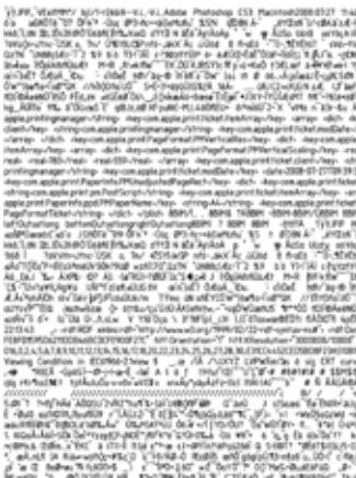
Christoph Engel Decode Daguerre, 2008 [Detail]