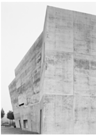
Christoph Engel Sichtbeton 10 (Rieselfeld 08), 2006

meiner angewandten Arbeit – besteht für mich eine gute Fotografie darin, dass sie mehr Fragen aufwirft als sie beantwortet. Damit lenkt sie das Interesse über das Bild hinaus auf das fotografierte Objekt. Ich versuche das, in dem ich durch Anschnitte die skulpturale Qualität des Gebauten betone und daran arbeite, ein Bild zu erzeugen, das im Charakter dem nicht abbildbaren Raumerlebnis ähnlich ist. Der Architekt wiederum legt Wert auf bestimmte Details und Anschlüsse und die illustrierende Übersicht. Diesen Diskurs – dass die Kamera nicht Realität aufnimmt, sondern projiziert; dass unsere Vorstellung nicht nur von dem angeregt wird, was wir sehen, sondern vor allem auch von dem, was wir nicht sehen und was unbestimmt bleibt – zu einem Konsens zu führen, ist Teil der angewandten Arbeit.