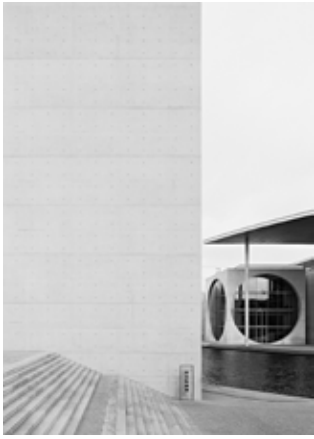
Christoph Engel Sichtbeton 07 (Paul-Marie 03), 2007